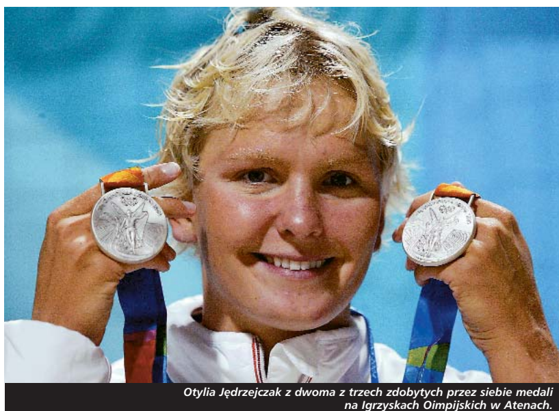
Otylia Jędrzejczak z dwoma z trzech zdobytych przez siebie medali na Igrzyskach Olimpijskich w Atenach.