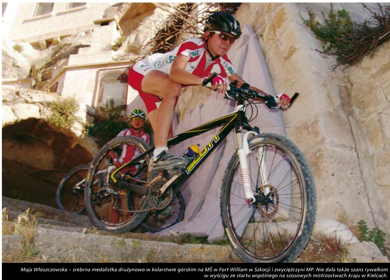
Maja Włoszczowska – srebrna medalistka drużynowo w kolarstwie górskim na MŚ w Fort William w Szkocji i zwyciężczyni MP. Nie dała także szans rywalkom w wyścigu ze startu wspólnego na szosowych mistrzostwach kraju w Kielcach.