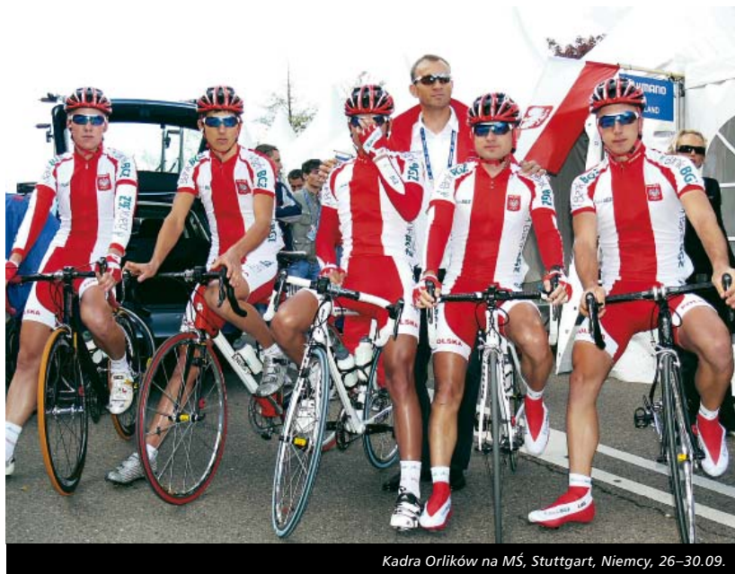
Kadra Orlików na MŚ, Stuttgart, Niemcy, 26–30.09.