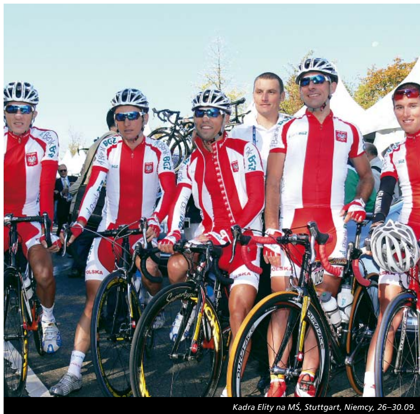
Kadra Elity na MŚ, Stuttgart, Niemcy, 26-30.09.